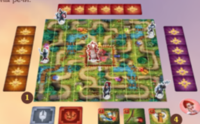
Пример подготовки к игре на продвинутом поле с продвинутыми манёврами для трёх участников